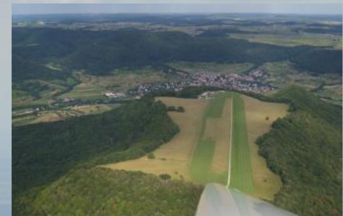
Flugplatz Farrenberg über die rechte Tragfläche hinweg

Segelfliegen kann man nur als Team. Jeder muss sich gleich stark einbringen. Die Teamarbeit auf dem Flugplatz ist die Basis, auf die sich unser Verein gründet.