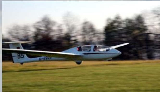
Flugschüler mit Lehrer beim Landen

Begleitet von einem unserer Vereins-Fluglehrer wird den Flugschülern die Technik und Theorie des Segelfluges in unserem Schulungsdoppelsitzer beigebracht.