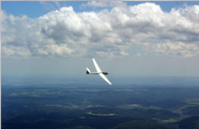
Kreisen in der Thermik

Je besser man dieses Spiel beherrscht, desto schneller lässt man sich vorantragen und gleitet über die Landschaft dahin.