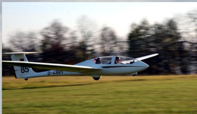
Flugschüler mit Lehrer beim Landen

Begleitet von einem unserer Vereins-Fluglehrer wird den Flugschülern die Technik und Theorie des Segelfluges in unserem Schulungsdoppelsitzer beigebracht.