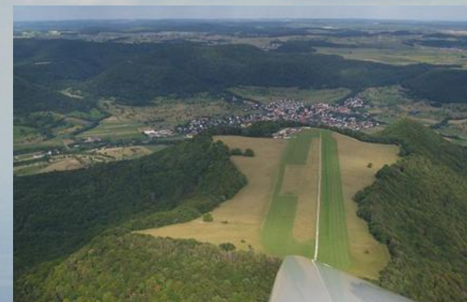
Unser Flugplatz Farrenberg

Segelfliegen kann man nur als Team. Die Teamarbeit auf dem Flugplatz ist die Basis, auf die sich unser Verein gründet.