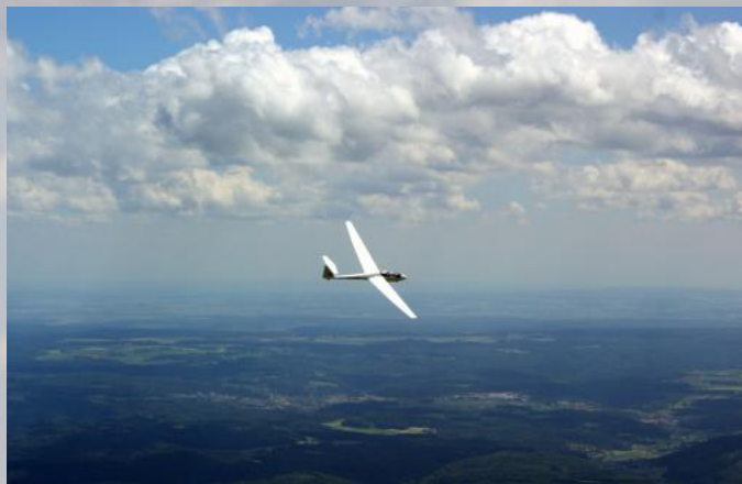
Kreisen in der Thermik

Je besser man dieses Spiel beherrscht, desto schneller lässt man sich vorantragen und gleitet über die Landschaft dahin.